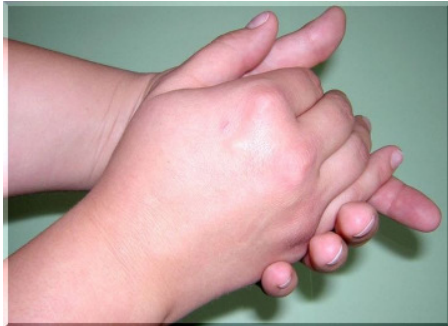
Schritt 1: Handfläche auf Handfläche reiben