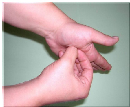
Schritt 6: Geschlossene Fingerkuppen in die rechte und linke Handfläche reiben

Das Desinfektionsmittel in die hohlen, trockenen Hände geben und nach dem oben aufgeführten Verfahren mindestens 30 Sekunden in die Hände bis zu den Handgelenken einreiben. Die Hände müssen während der gesamten Einreibzeit feucht sein.