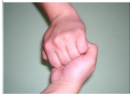
Schritt 4: Außenseite der Finger auf gegenüberliegenden Handflächen mit verschränkten Fingern reiben