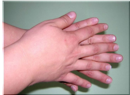
Schritt 2: Rechte Handfläche über linkem und linke Handfläche über rechtem Handrücken reiben